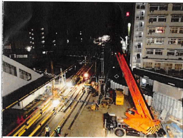
⑨仮設地下道関係工事状況