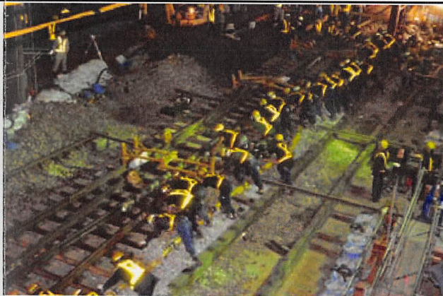
⑥仮線工事状況(7/26夜間)