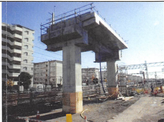
②高架橋工事状況(メトロ検車区付近)