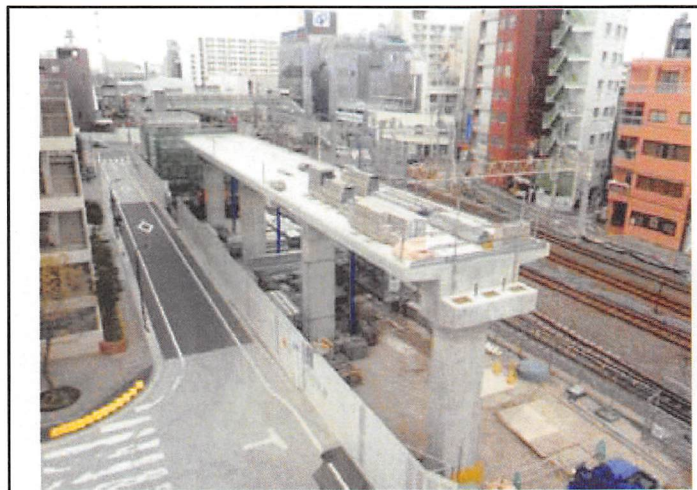
③高架橋工事状況(エミエルタワー前)