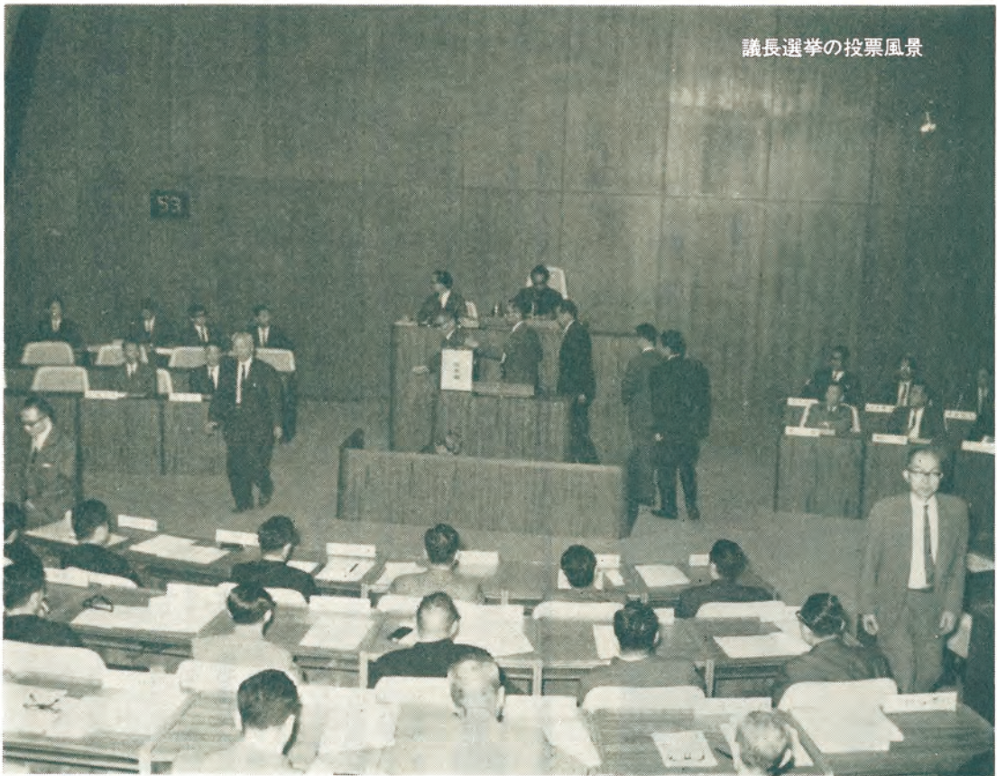
議長選挙の投票風景