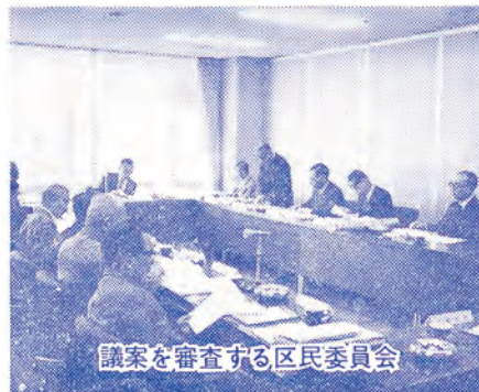
議案を審査する区民委員会

市街地未指定区域のため、市街地の指定をし、住居表示の方法を定めるもの町区域の新設および一部変更について