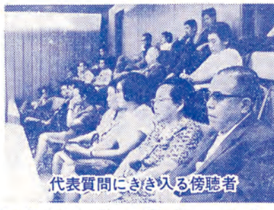
代表質問にきき入る傍聴者

均等割税の撤廃について 均等割は年所得20万円の階層から高額所得者と同額を徴収する悪税だ。撤廃を政府、都に要請す