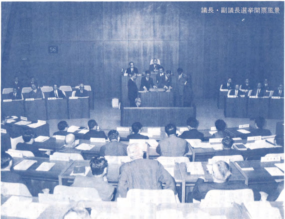
議長・副議長選挙開票風景