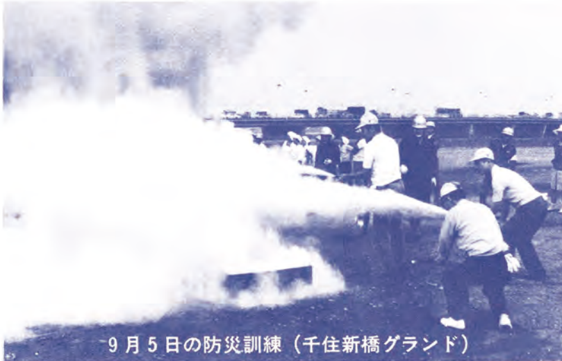
9月5日の防災訓練 (千住新橋グランド)