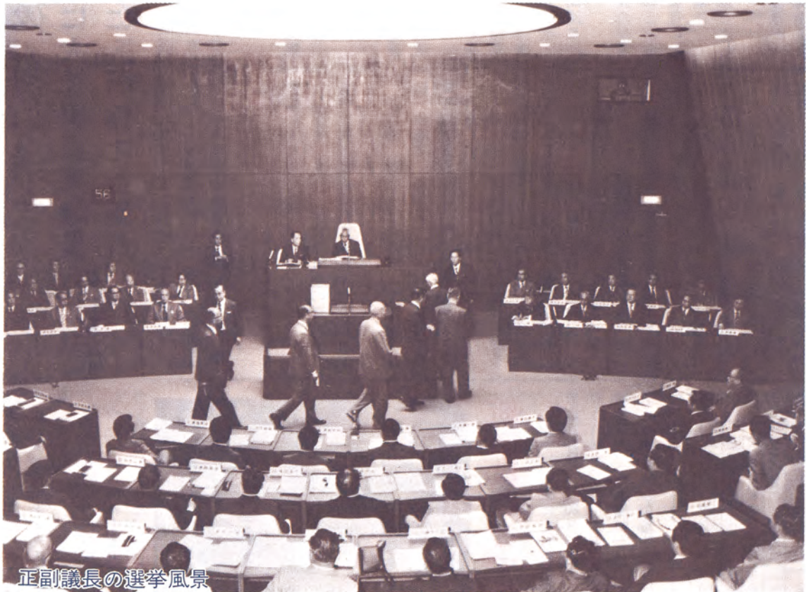
正副議長の選挙風景