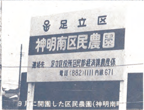
9月に開園した区民農園(神明南)