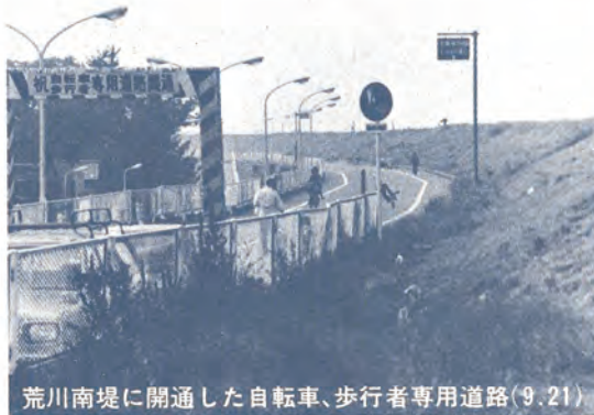
荒川南堤に開通した自転車、歩行者専用道路(9.21)

心身障害者福祉手当を昭和51年10月1日をもって、従前の5,500円から6,000円に増額します。