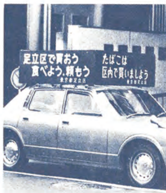
お買い物は区内で

進 ■継続審査となったもの ○足立郵便局移転計画に伴う跡地利用促進 (理由) 以上2件は、すでに建築確認済のため請願の趣旨にそいかねる。