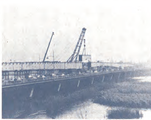
千住新橋付近の工事促進が待たれる

さらに、特別区はこれを契機に多様化する住民意識等をふまえ、将来への可能性とその展開を強く期待するものである。その一環として、「特別区」の名称を「特別市」に改称し、特別市は都との間に