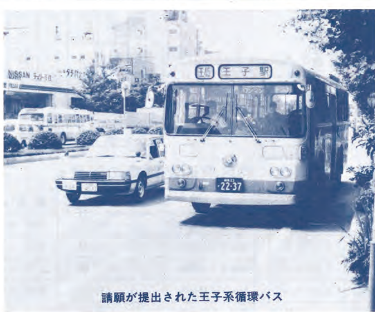
請願が提出された王子系循環バス

【答】現行制度の職員給与は、法律により民間従事等の給与を参考に決められるが、この方式は今後の研究の中で参考にしていきたい。