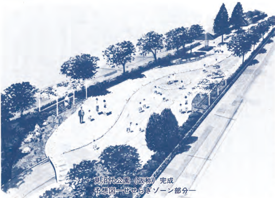
見沼代公園(仮称)完成 予想図一せせらぎゾーン部分一