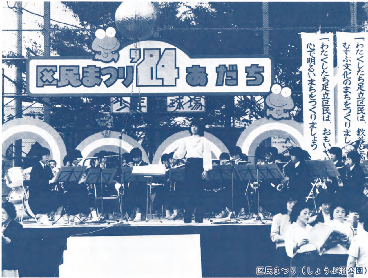
区民まつり (しょうぶ沼公園)