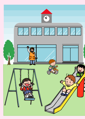
「あだち若者サポートステーション」

日本共産党足立区議団は多くの方々と懇談し、区民の切実な願いをまとめ、要望書を提出した。主なものは次のとおりである。 税制改定で影響を受ける区民に対し(仮称)「痛みやわらげ手当」等の対策を講ずること。 東武伊勢崎線竹ノ塚駅付近鉄道高架化事業を促進すること。 介護保険の1号被保険者保険料を引き下げることに。 老人施設におけるホテルコスト(食事代)の負担軽減を、一般会計で早急に実施すること。 自立支援法に関して利用者負担の軽減策を拡大・充実すること。 小児初期救急夜間診療を拡充すること。 認可保育園の増設を計画的に実施すること。また、保育料は今後も据え置くこと。